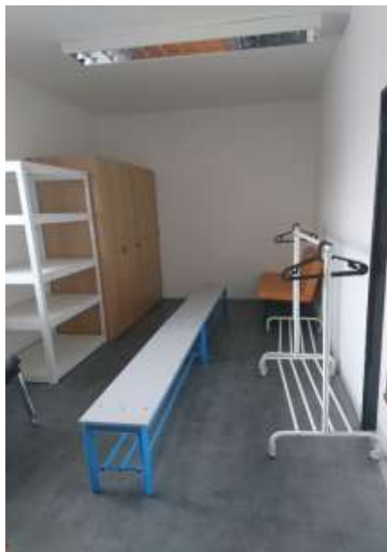
Obr.: Rekonstruované šatny žáků v Nemocnici ve Frýdku-Místku, p. o.