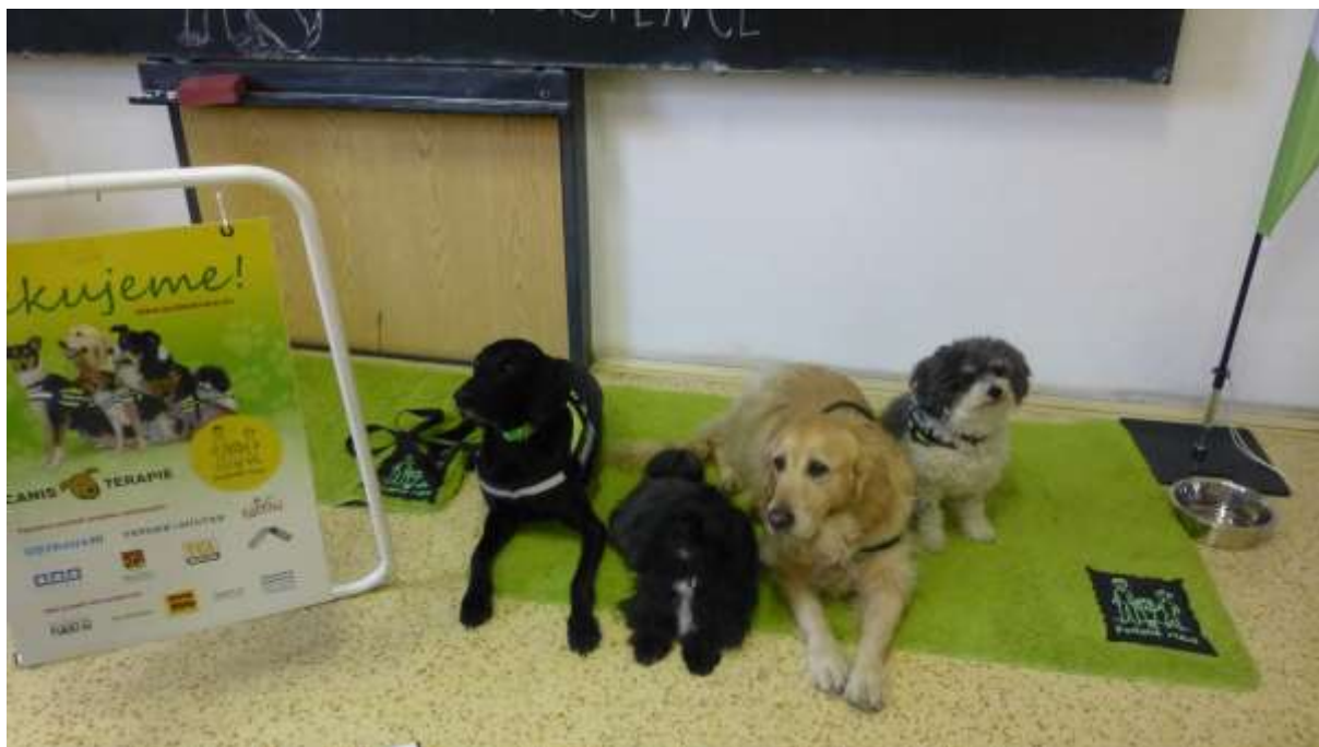
Obr.: Prezentace canisterapie v rámci Dne otevřených dveří