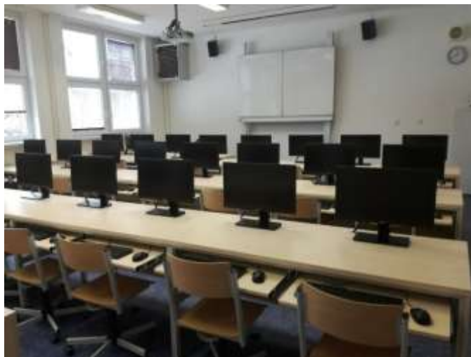
Obr.: Učebna výpočetní techniky II

Po rekonstrukci je využívána učebna č. 2. Škola tak má druhou, moderní učebnu pro výuku výpočetní techniky a informačních a komunikačních technologií. Učebna je vybavena novým nábytkem, moderní výpočetní technikou, která je prostorově úsporná, dataprojektorem, novou tabulí a dalším mobiliářem. Učebna byla financována z projektu Podpora digitálního vzdělávání v SŠ MSK – IT učebny. Učebna je bezbariérová.