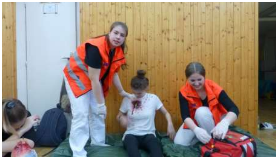
Obr.: Návuk poskytování první pomoci