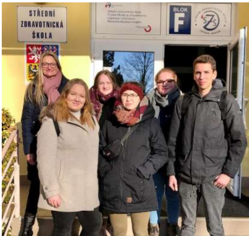
Obrázek: Němečtí žáci na návštěvě ve Střední zdravotnické škole, Frýdek-Místek

V prosinci roku 2019 navštívili dva zástupci Střední zdravotnické školy, Frýdek-Místek, p. o., partnerskou školu v polské Bytomi (Zespól Policealnych Szkół Medyczno-Społecznych), kde se seznámili s novým oborem – pečovateli o děti. Nadále tak pokračuje i přeshraniční spolupráce s Polskem.